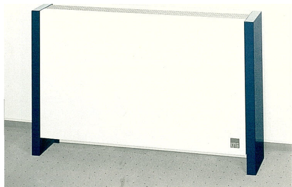
LTG omkasting, staal in RAL kleur