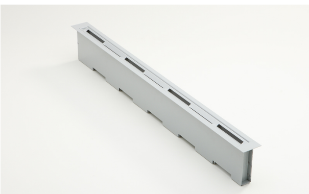
Vloerluchtrooster, type LDU, voor overdruk bodem