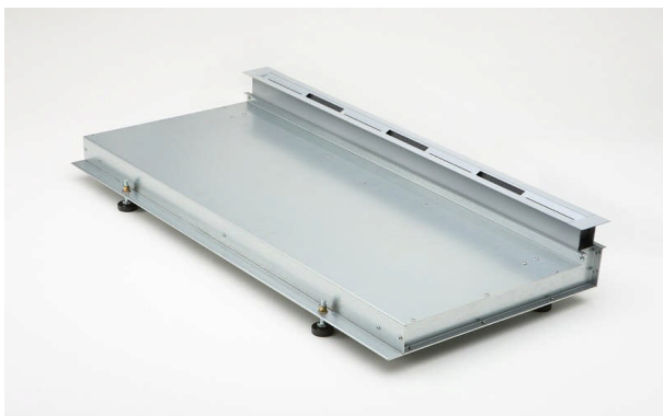
Vloerluchtrooster, type LDU, met lucht aansluiting onder