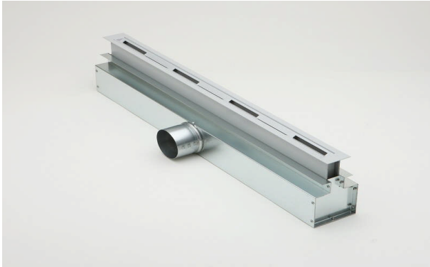
Vloerluchtrooster, type LDU, met zijdelingse luchtaansluiting