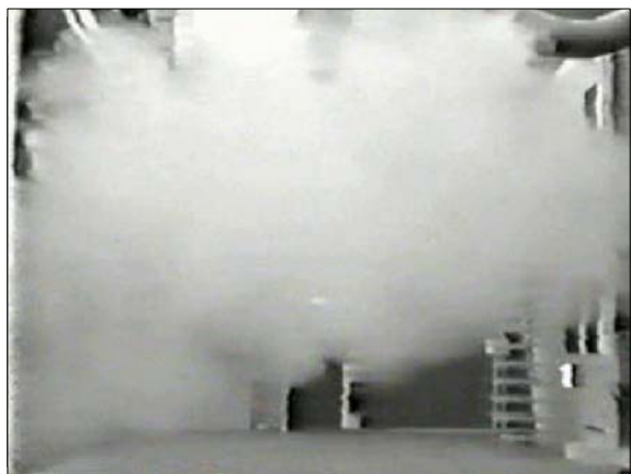
Instelling koelen = verdringing