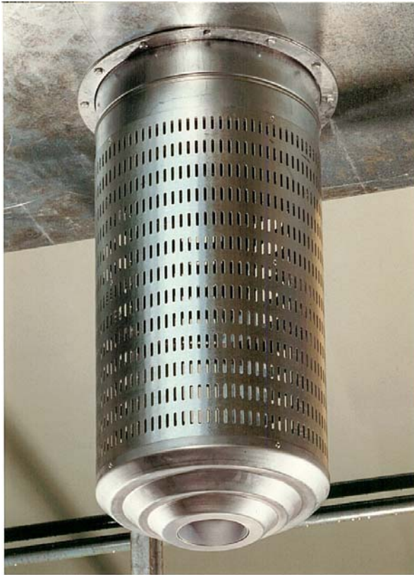
DLD met nozzle omkasting