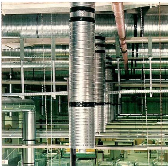
DLD met nozzle omkasting Voorbeeld: Industriehal